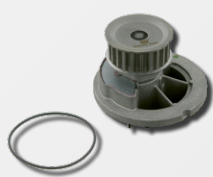
SWAG no. 40 92 4314