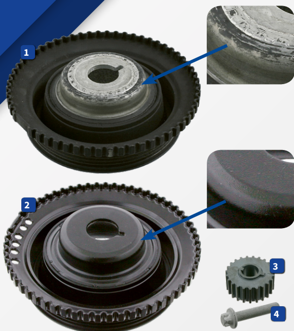
Opel 5614 430 plan