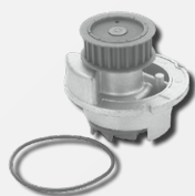
SWAG no. 40 15 0029