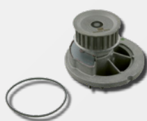
SWAG no. 40 92 4314 pour les moteurs 1,4 l et 1,6 l 16V