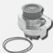
SWAG no. 40 15 0029 pour le moteur 1,8 l 16V