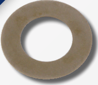
Elmas kaplamalı krank keçesi

SWAG'ın krank keçeleri yüksek kaliteli nikel-elmas kaplamalıdır ve kasnağı titreşimlerden korur. Ayrıca, en uygun güç aktarımını sağlar. Yüksek maliyetli hasarlardan kaçınmak için, elmas kaplı krank keçesini içeren, Volvo 850, S70, S80, V70 I, V70 II, VW Crafter/T4, Audi A6 araçlarına uygun SWAG kasnak tamir takımlarını kullanınız.