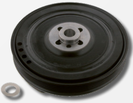
TVD Krank kasnak tamir takımı