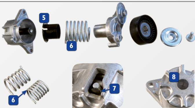
SWAG no. 10 92 6775 nr. ref. 646 200 05 70

For more technical information please visit: partsfinder.bilsteingroup.com