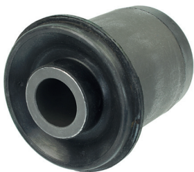
Арт. MEYLE: 36-14 710 0000/HD