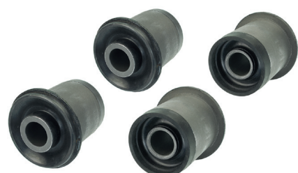
Арт. MEYLE: 36-14 710 0001/HD