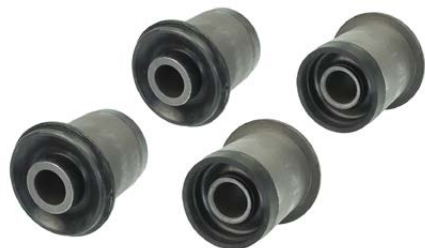
Nr MEYLE: 36-14 710 0001/HD