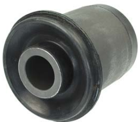
Nr MEYLE: 36-14 710 0000/HD