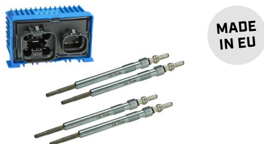
MEYLE-Nr. 614 880 0006/S, Kurznr. MEX0548 inkl. 4 Glühkerzen für OPEL, VAUXHALL