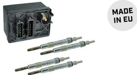
MEYLE-Nr. 014 880 0010/S, Kurznr. MEX0091 inkl. 6 Glühkerzen für Mercedes-Benz E300