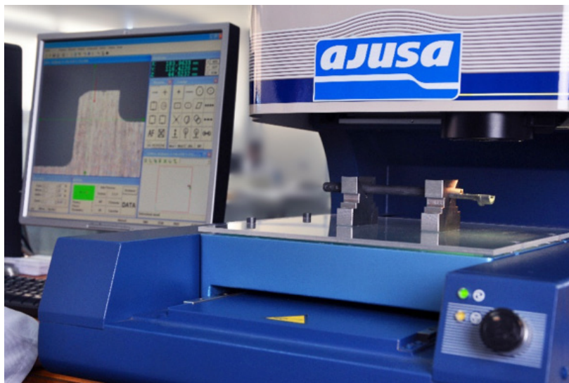
Ilustración 1 Medición Visión Artificial

La búsqueda de unos motores más eficientes, además de los compromisos en lo correspondiente al medio ambiente, ha hecho que se plasme de manera directa en unos requerimientos más estrictos a la hora de fabricar juntas de estanqueidad, ya que un incorrecto diseño puede hacer que la eficiencia del vehículo caiga. Es por ello que se hace necesario para un fabricante como AJUSA, la utilización y manejo de las últimas herramientas tecnológicas en lo que al diseño y verificación de este tipo de producto se refiere.