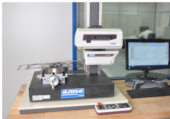
Ilustración 3 Medición de Perfiles

Otras herramientas de medición y verificación como podría ser el perfilómetro, nos asegura un proceso de mayor precisión ahí donde realmente la junta realiza la estanqueidad, y así es como se pueden estudiar morfología en las embuticiones generadas a juntas metálicas, que es por donde se dirige el mercado, donde valores en lo ángulos de embutición, alturas y morfología hacen que el rendimiento de la junta pueda variar sensiblemente ante pequeñas variaciones de estas magnitudes. Así pues, se puede expresar la necesidad de tener una medición por contacto donde la precisión inferior a la micra de milímetro hace de esta herramienta fundamental tanto para el diseño como para la posterior verificación de las fabricaciones.