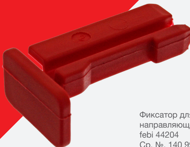
Фиксатор для заглушки направляющей щупа febi 44204 Ср. №. 140 991 00 55

Перед измерением уровня масла при помощи подходящего инструмента обломите фиксатор, вытащите стопорный штифт и снимите заглушку (Рис.3).