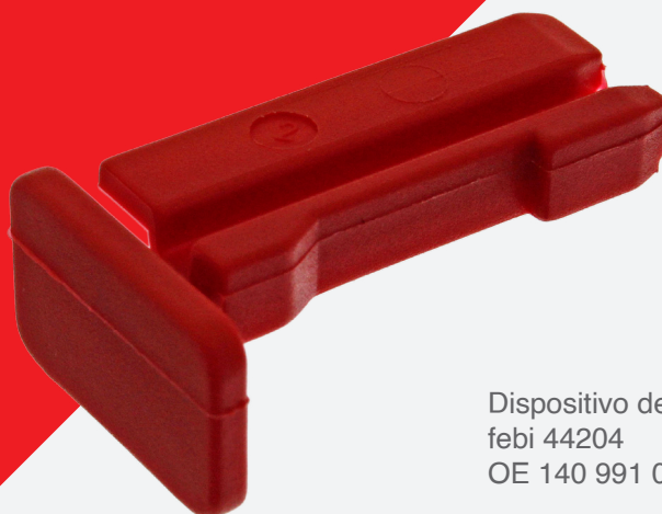
Dispositivo de segurança febi 44204 OE 140 991 00 55

Para efetuar a leitura do nível do óleo é necessário remover o dispositivo de segurança (Fig. 2). Remova o dispositivo de segurança e retire a tampa do tubo (Fig. 3) (não é possível retirar o dispositivo de segurança sem o partir).