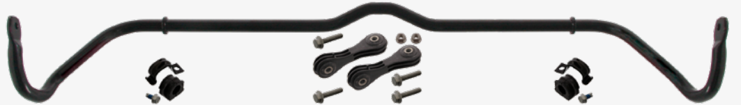
Resim 2 Viraj denge çubuk kiti, bağlantı kolları ve montaj elemanları ile beraber

Bu sebepten ötürü, febi size viraj denge çubuk kitini sunuyor. Örneğin VW Golf IV için febi no. 36630 (resim 2) sadece denge çubuğunu değil, bütün bağlantı elemanlarını da içerisinde bulundurmaktadır. Bu birleşim size profesyonel bir tamirat sağlar ve oluşabilecek şikâyetlerin önüne geçer. Hem müşterinin hem de tamirhanenin zamanını ve parasını korur.