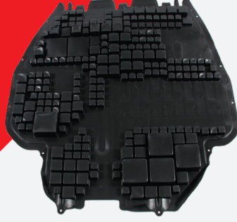
غطاء منطقة المحرك مع خصائص عازلة للحد من الضوضاء فمثلاً للسيارة فولكس واجن جولف .VW Golf IV febi 33543