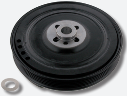
TVD Krank kasnak tamir takımı