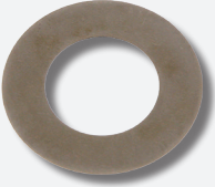
Elmas kaplamalı krank keçesi

febi krank keçeleri yüksek kaliteli nikel-elmas kaplamalıdır ve kasnağı titreşimlerden korur. Ayrıca, en uygun güç aktarımını sağlar. Yüksek maliyetli hasarlardan kaçınmak için, elmas kaplı krank keçesini içeren, Volvo 850, S70, S80, V70 I, V70 II, VW Crafter/T4, Audi A6 araçlarına uygun febi kasnak tamir takımlarını kullanınız.