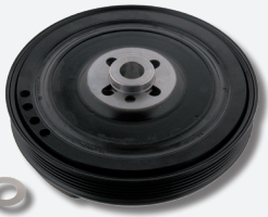
طقم التصليح قرص السير