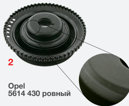
Opel 5614 430 ровный