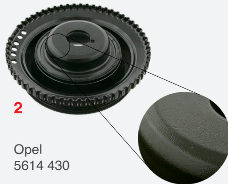
Opel 5614 430

Para mais informação, visite: partsfinder.bilsteingroup.com