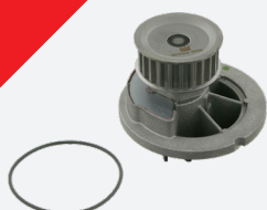
febi 24314 para o motor 1.4l, 1.6l 16V

Em qualquer caso, deve substituir a bomba de água!