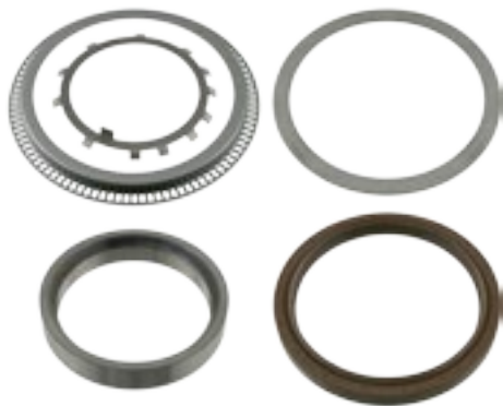
Установочный комплект уплотнений для ступичного подшипника febi № 24762

подходит для: Actros I+II+III+IV, Antos, Atego 18t →, Axor I+II, Integro, Intouro, O 500, O 350 / Turismo, O 530 / Citaro, O 580 / Travego, Touro, Setra Serie 4, Chassis, CBC, IBC, Multego Ср. № 942 350 39 35