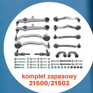
komplet zapasowy 21500/21502