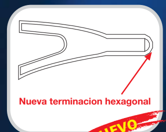
Nueva terminacion hexagonal