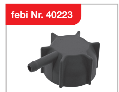
Deckel für Kühlerausgleichsbehälter

febi Ersatzteile und weitere Kühlerausgleichsbehälter finden Sie unter: www.trucks.febi-parts.com