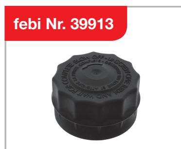
Deckel für Kühlerausgleichsbehälter