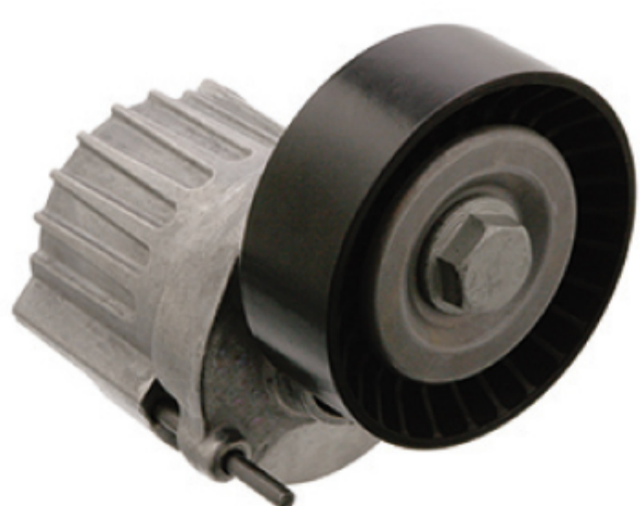
febi № 27618