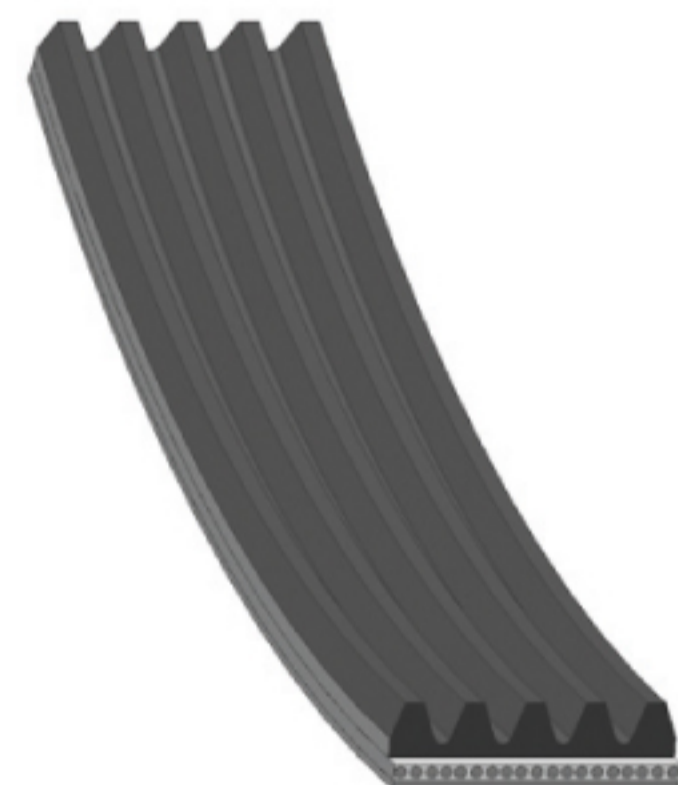
febi № 37533