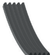
Ref. febi 37533