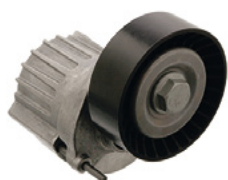
febi č. 27618