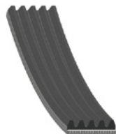
febi č. 37533