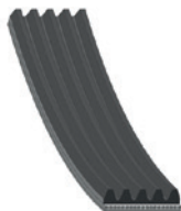
febi no. 37533