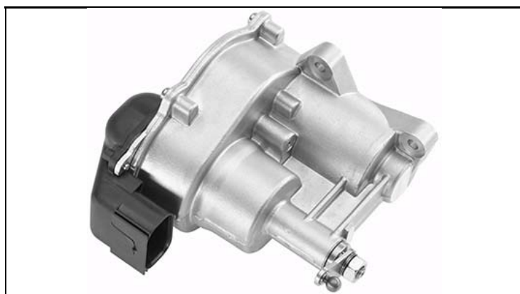
1 - Produkt / Product