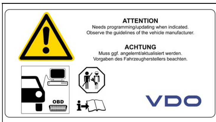
3 - Montage Hinweise / Installation Notes

Nennspannung (Positionssensor) / Nominal Voltage (Position Sensor) = 5 V