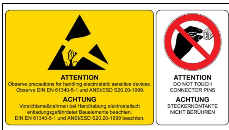
4 - ESD Hinweise / ESD Notes