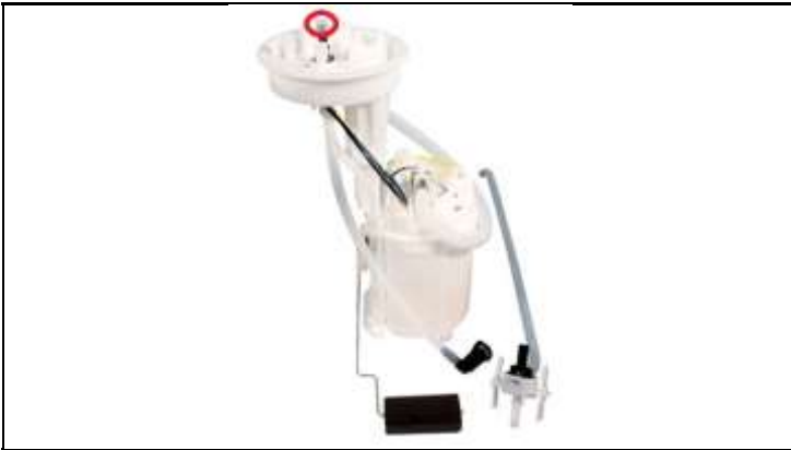
Abbildung Foerdereinheit / Picture of Fuel Supply Unit

Betriebsspannung / Voltage: 6-15 V Foerderdruck / delivery pressure: \leq 4 bar VL= Vorlauf / Inlet flow RL= Rucklauf / Outlet flow