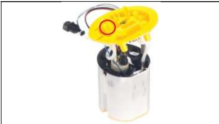
Abbildung Foerdereinheit / Picture of Fuel Supply Unit

Betriebsspannung / Voltage: 5 - 15 V Foerderdruck / delivery pressure: 4 bar Foerdermenge / delivery rate: \geq 175 l/h Pumpenanlaufstrom / pump starting current: < 5 A VL= Vorlauf / Inlet flow RL= Rücklauf / Outlet flow