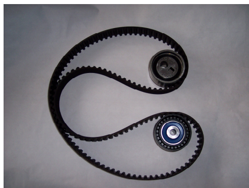
Conteúdo dos novos kits SKF VKMA 03244/03247

© SKF é uma marca registrada do Grupo SKF.