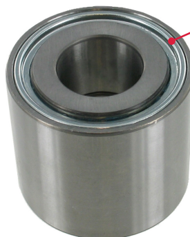
Protector metálico doblado doble: exterior