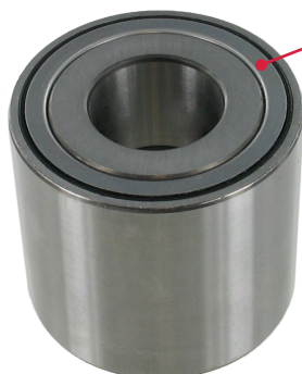
Protector metálico con retén de caucho integrado: interior

La unidad VKBA 3680 se suministra con las instrucciones de montaje MI-542027 con el fin de destacar la importancia de realizar una comprobación visual de ambos lados del rodamiento antes del montaje.