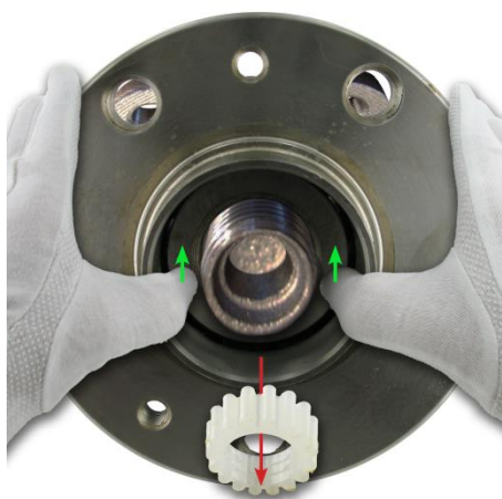
Tijekom pravilne montaže osovina će istisnuti plastičnu čahuru. Nemojte je vaditi prije montaže.