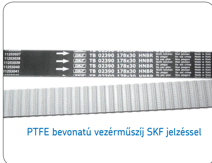
PTFE bevonatú vezérműszíj SKF jelzéssel

© Az SKF az SKF Csoport bejegyzett védjegye.