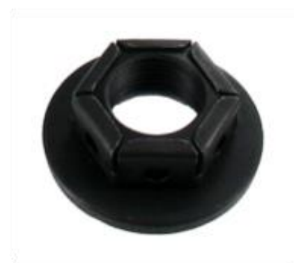
Predhodna SKF konstrukcija matice