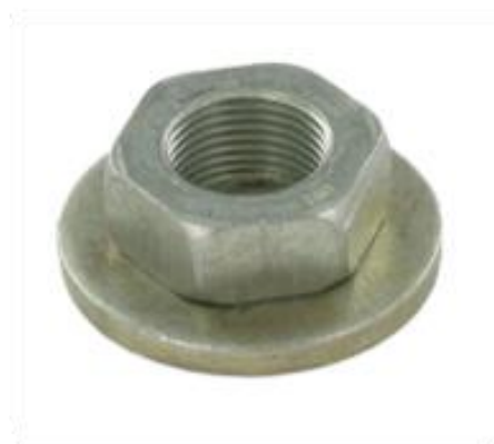
Nova SKF konstrukcija matice