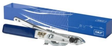
Narzędzie zaciskowe do uniwersalnych opasek: VKN 400

Podczas montażu uniwersalnej osłony przegubu zaleca się odciąć nadmiar gumy dopiero po zamontowaniu opaski zaciskowej.