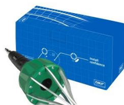
Pneumatyczny rozpieracz do osłon: VKN 402

Do profesjonalnej naprawy, podczas zaciskania opasek zalecane jest użycie narzędzia SKF VKN 400.