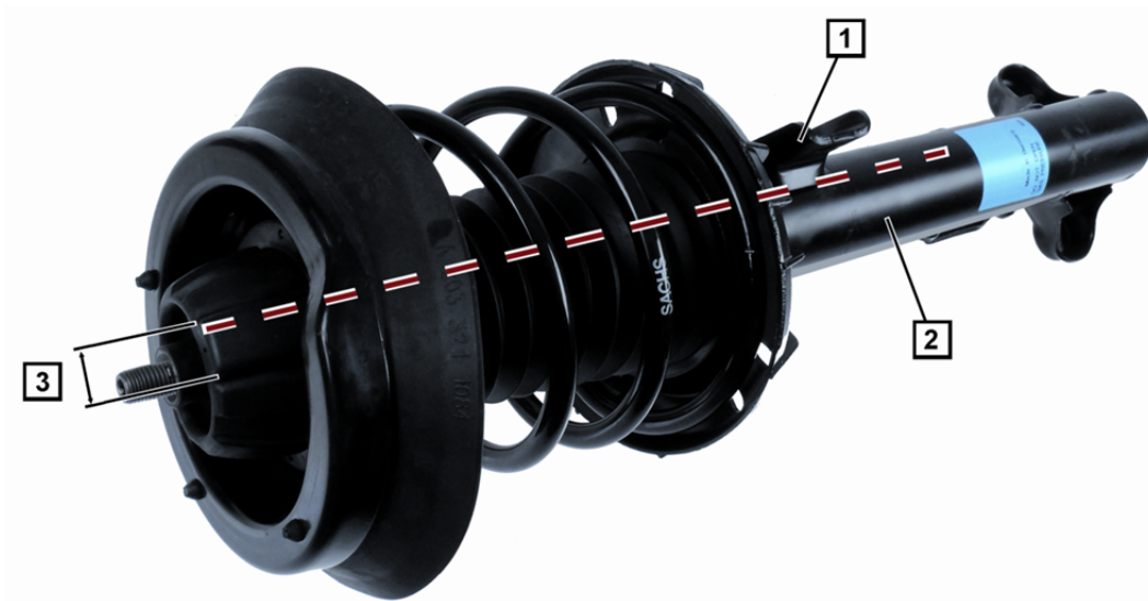
Fig. 1: Federbein