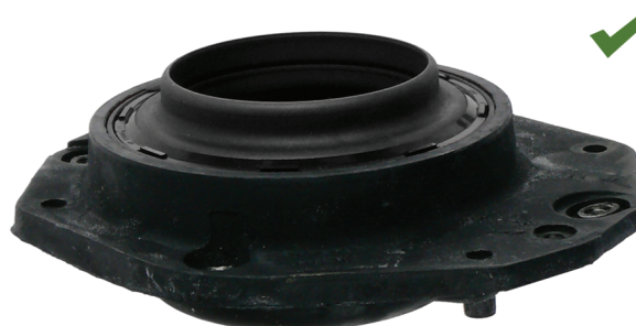
Fig. 2: Ispravno montiran osloni ležaj opružne noge