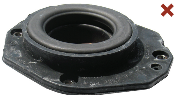
Fig. 1: Neispravno montiran osloni ležaj opružne noge

Citroën Berlingo / Xsara / ZX Peugeot 306 / Partner