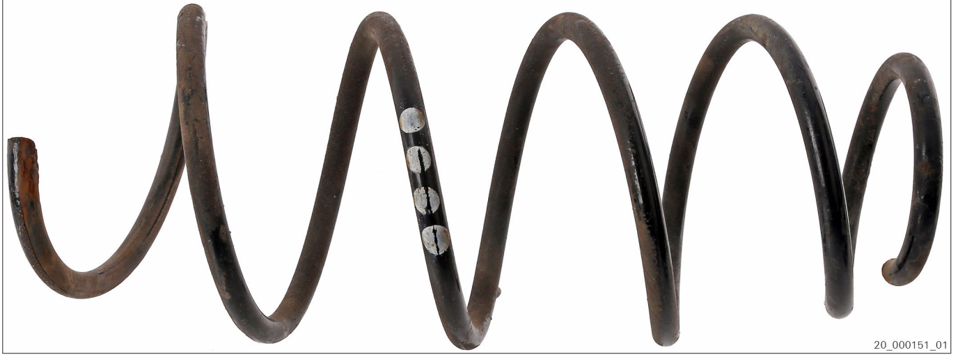
Şek. 2 Renk etiketli kullanılmış süspansiyon yayı (örnek)