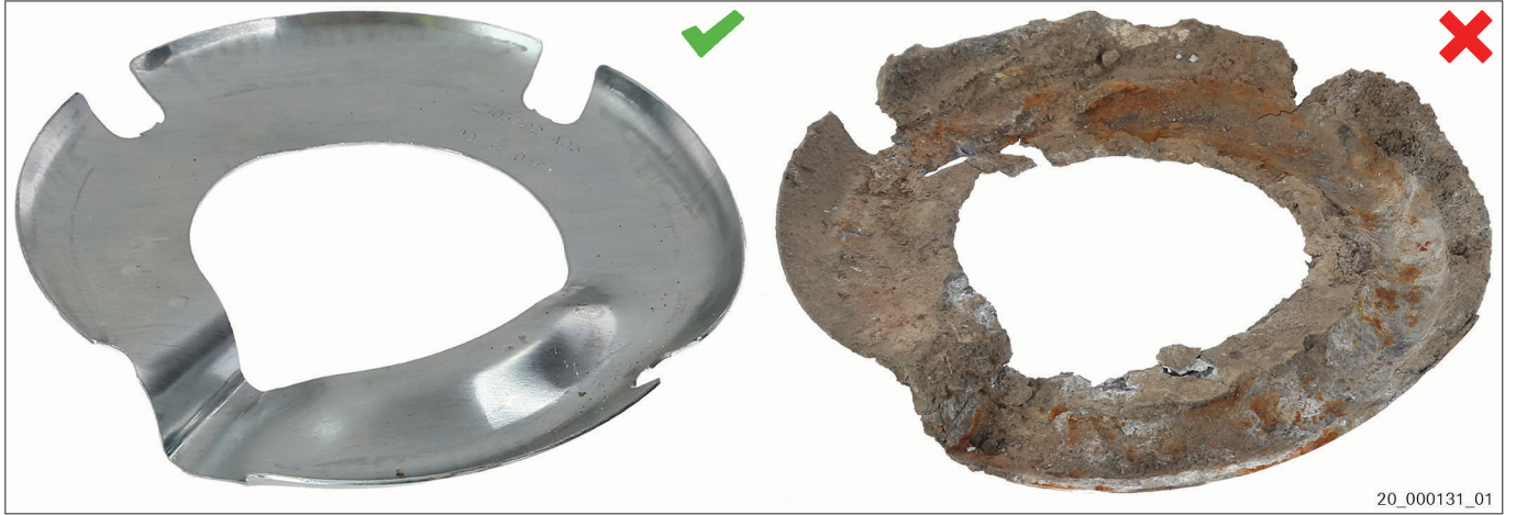
Şek. 3 Yeni kurban anot | Kullanılmış kurban anot

Kurban anot, adi metalden (ör. alüminyum) yapılmış bir elektrottur. Değerli metalden (ör. çelik) yapılmış bileşenleri temas korozyonundan korur. Kurban anodun ana metali işlem sırasında tahrip edilir. Böylelikle korozyona karşı hassas olan metal parçaların işlevini yerine getirmesi sağlanır ve parçaların dayanıklılığı uzatılır.