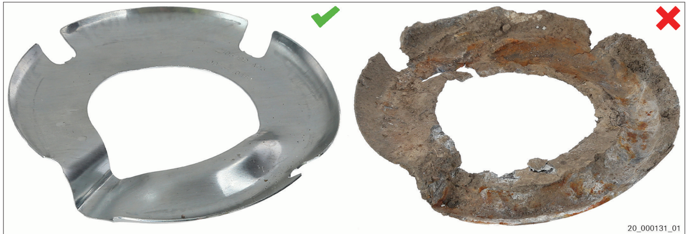
Εικ. 3 Καινούργιο προστατευτικό ανόδιο | Μεταχειρισμένο προστατευτικό ανόδιο

Το προστατευτικό ανόδιο είναι ένα ηλεκτρόδιο από κοινό μέταλλο (π.χ. αλουμίνιο). Προστατεύει τα εξαρτήματα από κοινό μέταλλο (π.χ. ατσάλι) έναντι διάβρωσης. Κατά τη διαδικασία αυτή, το κοινό μέταλλο του προστατευτικού ανοδίου καταστρέφεται. Έτσι, διασφαλίζεται η λειτουργία των μεταλλικών εξαρτημάτων που μπορούν να διαβρωθούν και παρατείνεται η διάρκεια ζωής των εξαρτημάτων.