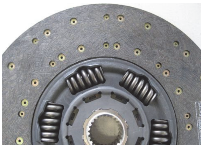
Obr.č. 3: Obložení lamely na straně k převodovce

Obložení na straně k převodovce (Obr.č.3) se nejprve lepí na jiný, nosný plech, na který se pak nanýtují torzní pružiny.