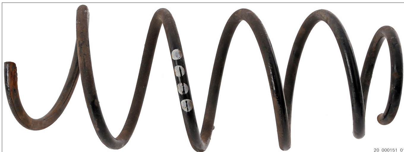
Obr. 2 Použité pružiny podvozku s farebným označením (príklad)