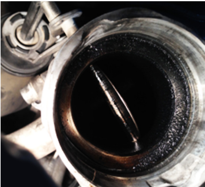
Рис. 4: Закоксовывание заслонки клапана системы рециркуляции ОГ