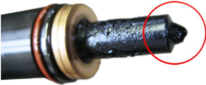
Рис. 3: Закоксовывание элемента сопла насоса