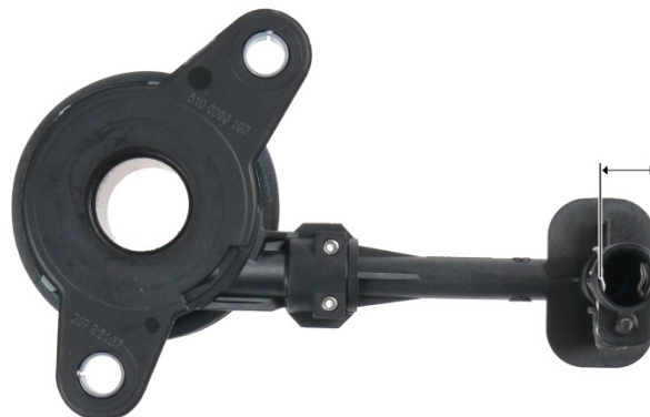
Kuva 4: CSC 3182 600 140 → 3182 654 204 Hydrauliikkaliitännän halkaisija 12,2 mm

Huomioi, että tämän tiedotteen kuvat eivät ole mittakaavassa.