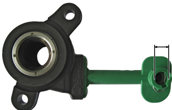
Kuva 1: CSC 3182 600 121 → 3182 654 165 Hydrauliikkaliitännän halkaisija 11,7 mm