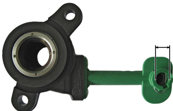
Afb. 1: CSC 3182 600 121 → 3182 654 165 Diameter hydraulische aansluiting: 11,7 mm