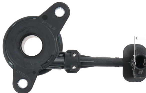
Afb. 4: CSC 3182 600 140 → 3182 654 204 Diameter hydraulische aansluiting: 12,2 mm

Houd er rekening mee dat de hydraulische aansluitingen van de druklagers niet op ware grootte zijn afgebeeld.