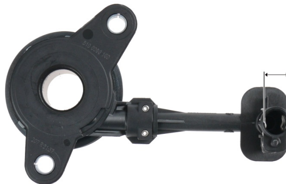
Fig. 4: CSC 3182 600 140 → 3182 654 204 Diámetro de la conexión hidráulica: 12,2 mm

Las conexiones hidráulicas de los dispositivos de desembrague no están representadas a escala.