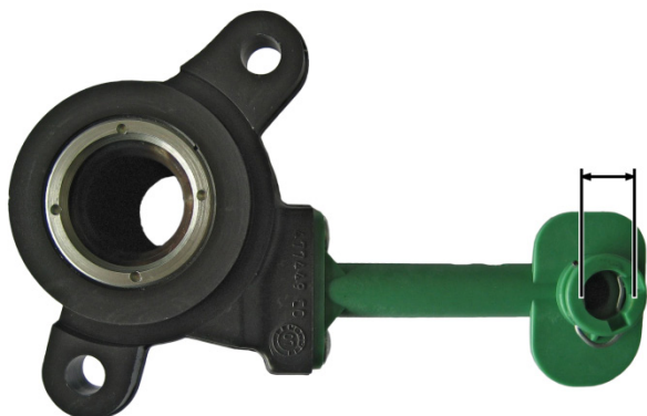
Fig. 1: CSC 3182 600 121 → 3182 654 165 Diámetro de la conexión hidráulica: 11,7 mm