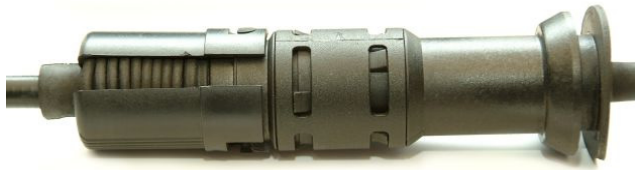
Fig. 1: Seguro con cierre de bayoneta