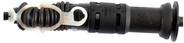
Fig. 2: Dispositivo di sicurezza con chiusura con plastica

I comandi a cavo con meccanismo di regolazione automatico sono assicurati con chiusura a baionetta (fig. 1) o una fascia di plastica bianca (fig. 2).