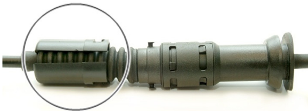
Fig. 3 : Sécurisation desserrée

➔ Le câble d'embrayage s'ajuste automatiquement après actionnement de la pédale d'embrayage.