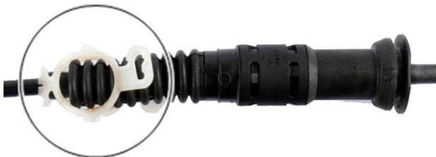
Fig. 5 : Sécurisation desserrée

➔ Le câble d'embrayage s'ajuste automatiquement après actionnement de la pédale d'embrayage.