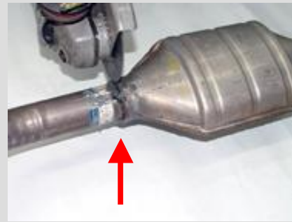
2. Defektes Rohr an der markierten Stelle (Schweißnahtbereich am Kat mit der Flex abtrennen.