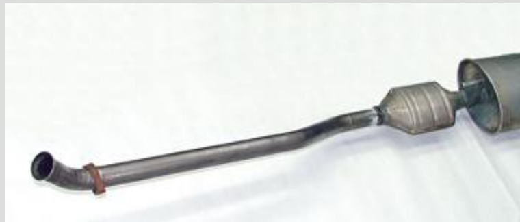
1. Defekte Katalysator-Schalldämpfer-Einheit ausbauen.

Ist ein Rohr gerissen, muss nicht gleich der gesamte Katalysator ausgetauscht werden. Die clevere Alternative sind Ersatzrohre von ERNST. Schritt für Schritt zeigt Ihnen die folgende Anleitung, wie Sie das Reparaturrohr korrekt an den Katalysator montieren.