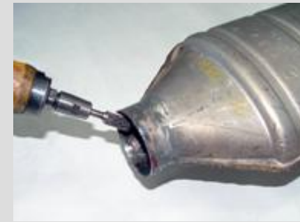
3a. Defektes Rohr entfernen, Kat-Eintrittskonus von allen Reststücken befreien, mit Druckluftschleifer runden und glätten.