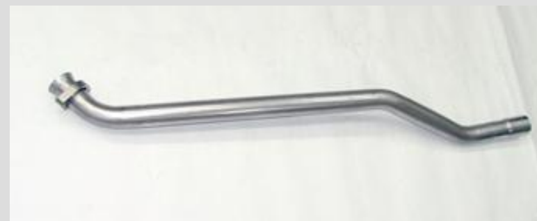
4. Neues Reparaturrohr 391 48 1 mit Flansch bereitlegen.