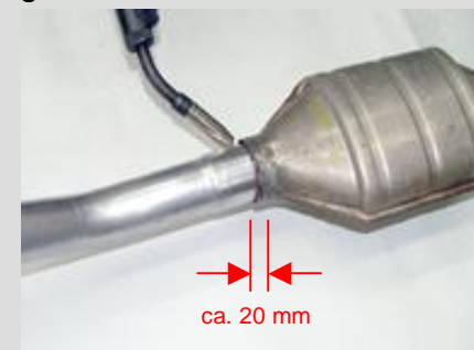
5. Neues Rohr ca. 20 mm in den Kat-Eintrittskonus einschieben, positionieren und verschweißen. Reparierte Einheit dann wieder einbauen.