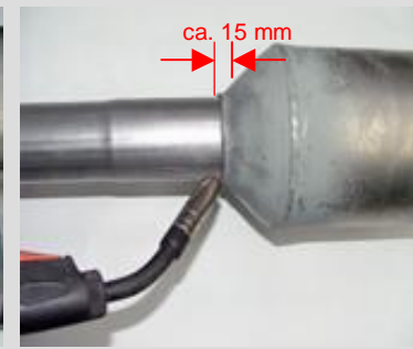
6. Neues Rohr ca. 15 mm in den Kat-Eintrittskonus einschieben, positionieren und verschweißen. Reparierte Einheit dann wieder einbauen.