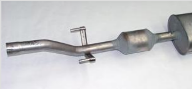
1. Defekte Katalysator-Schalldämpfer-Einheit ausbauen.

Ist ein Rohr gerissen, muss nicht gleich der gesamte Katalysator ausgetauscht werden. Die clevere Alternative sind Ersatzrohre von ERNST. Schritt für Schritt zeigt Ihnen die folgende Anleitung, wie Sie das Reparaturrohr korrekt an den Katalysator montieren.