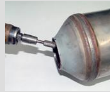
3. Defektes Rohr entfernen, Kat-Eintrittskonus von allen Reststücken befreien und mit Druckluftschleifer runden und glätten. Erforderlicher Durchmesser der Öffnung = ca. 63 mm