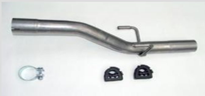
4. Neues Reparaturrohr 391 47 4 und Montageteile bereitlegen.