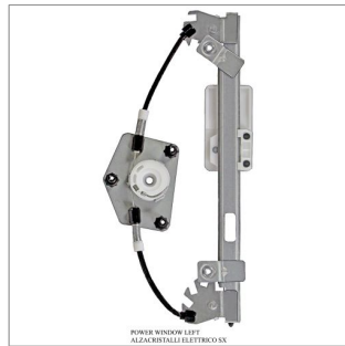
POWER WINDOW LEFT ALZACRISTALLI ELETTRICI SX

Alzacristalli di ricambio / Elevavinas de recambio