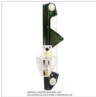
ORIGINAL POWER WINDOW LEFT ALZACRISTALLI ELETTRICI ORIGINALI SX

Alzacristalli originale / Elevavinas original