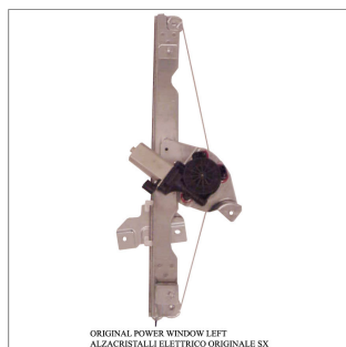
ORIGINAL POWER WINDOW LEFT ALZACRISTALLI ELETTRICI ORIGINALE SX

Lève-vitre d'origine / Original-Fensterheber Alzacristalli originale / Elevavinas original