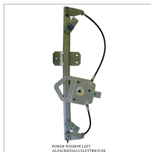
POWER WINDOW LEFT ALZACRISTALLI ELETTRICI SX

Lève-vitre de remplacement / Ersatz-Fensterheber Alzacristalli di ricambio / Elevavinas de recambio